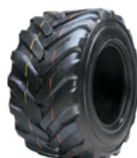
Deestone 31 x 15.50 - 15 D316

Breite des Bandes 384 mm Dia des Bandes 766 mm Breite der Maschine 1434 mm ET -40