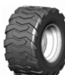
Mitas 31.0/15.5-15 SK-02 TL 119A4

Breite des Bandes 282 mm Dia des Bandes 798 mm Breite der Maschine 1292 mm ET 0