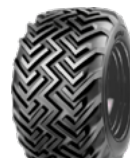
Mitas 31x15.5-15 TR06

Breite des Bandes 315 mm Dia des Bandes 840 mm Breite der Maschine 1425 mm ET -50