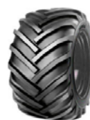
Mitas 15.5-15 TR 07 TL 109/121A8

Breite des Bandes 391 mm Dia des Bandes 792 mm Breite der Maschine 1401 mm ET 0