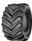
Alliance 31 x 15.50 - 15 NHS 332

Breite des Bandes 400 mm Dia des Bandes 795 mm Breite der Maschine 1410 mm ET 0