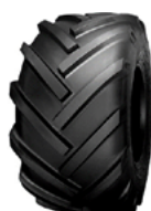
Trelleborg 400/50-15 T463

Bei Fragen bitte kontaktieren Sie unser Verkaufsteam unter +31 (0)76 504 66 66 oder senden Sie eine E-Mail an sales@peetersgroup.com