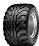
Vredestein 400/60-15.5 Flotation +

Breite des Bandes 370 mm Dia des Bandes 760 mm Breite der Maschine 1460 mm ET -40