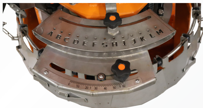
Streumengen- und Streubildverstellung aus Edelstahl über gelaserte Skalen einstellbar.