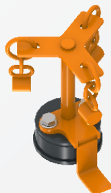
Rührwerk RW 40 für Salz-Splittgemisch