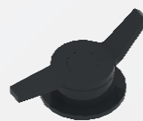
Rührwerk RW 60 für Splitt