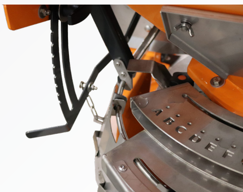
Manuell verstellbarer Streubreitenbegrenzer links / rechts

Der Streuer WDS 751E bietet im Vergleich zum Modell WDS 751 erweiterte Funktionen durch seine elektrische Steuerung. Die Geschwindigkeit des Trägerfahrzeugs wird per GPS ermittelt, sodass die Ausbringmenge wege-abhängig gesteuert wird. Zudem ermöglicht das elektrische Steuerpult eine bequeme Einstellung der Streubreite direkt vom Trägerfahrzeug aus.