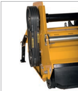
Zapfwellendrehzahlen von 540 oder 1.000 U/min sind beim MU-L Vario 180-250 möglich.