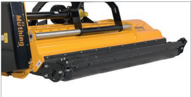
Mit zwei stabil ausgeführten Adapterplatten lässt sich die Gutablage auch vor der Stützwalze realisieren (optional).