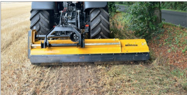
Hydraulische Seitenverschiebung: Versetztes Mulchen neben dem Traktor schafft Flexibilität bei Bäumen, Einfahrten oder anderen Hindernissen (optional).

MU-Vario® für eine optimierte Einlass- und Gehäuseform und einen stufenlos wählbaren Zerkleinerungsgrad. Dadurch werden ideale Mulchqualität und Zerkleinerung erreicht.