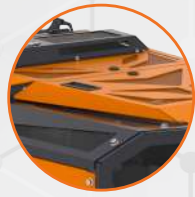
PROTECTION RENFORCÉE DU RADIATEUR