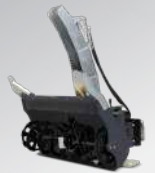
FRAISE A NEIGE