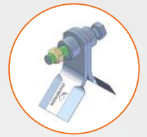
GROUPE DE BROYAGE Rotor avec couteaux Y