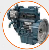
MOTEUR KUBOTA DIESEL 25 CH