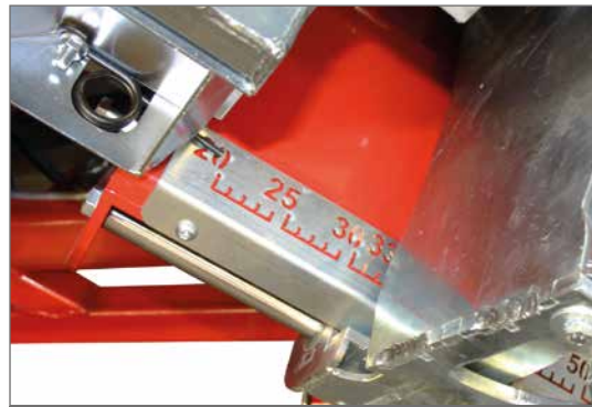
Verstellbarer Längenanschlag mit Feinstufen von 20 bis 52 cm