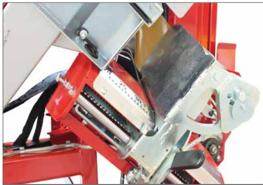
Längenanschlag mit Holzanwesenheitserkennung