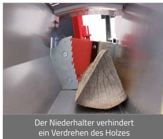
Der Niederhalter verhindert ein Verdrehen des Holzes