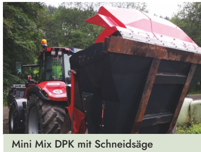
Mini Mix DPK mit Schneidsäge