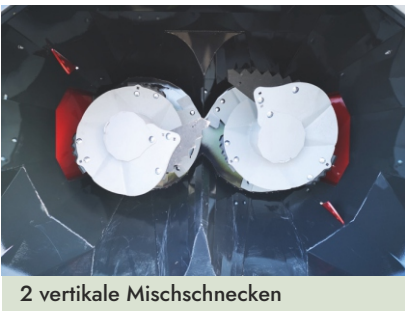
2 vertikale Mischschnecken