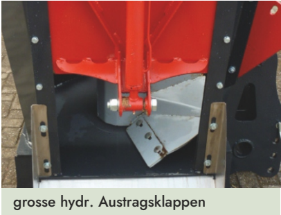
grosse hydr. Austragsklappen