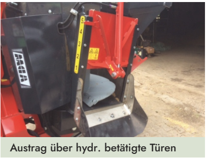
Austrag über hydr. betätigte Türen