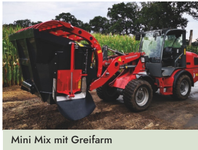
Mini Mix mit Greifarm