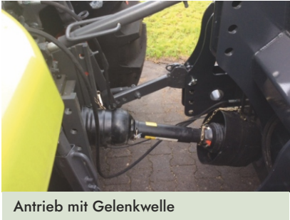
Antrieb mit Gelenkwelle