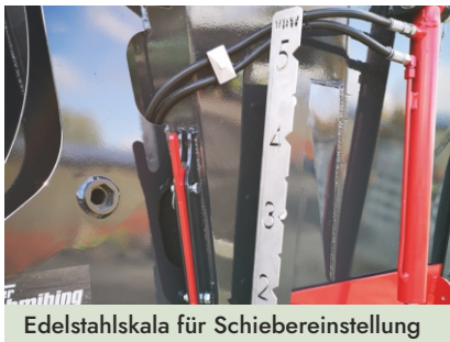
Edelstahlskala für Schiebereinstellung