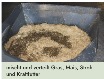
mischt und verteilt Gras, Mais, Stroh und Kraftfutter