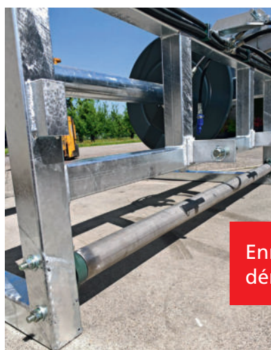
Enrouleur avec rouleau dérouleur