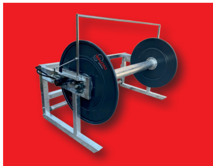
Enrouleur SH 1000, version extra large, avec entraînement hydraulique (2 moteurs hydrauliques) et attelage à 3-points

La distribution du purin rationnelle et précise