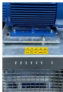
Gut zugängliche Zentralschmierung Graissage centralisé facilement accessible