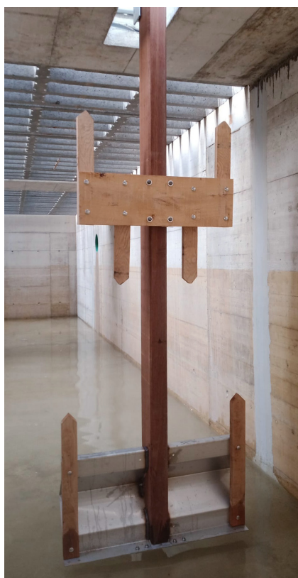
Rührschaufel (Bongossi-Balken mit Inox-Rührschaufel, oben 2. Schaufelblatt aus Holz) Pale de brassage (poutre Bongossi avec pale en inox, en haut la 2e pale en bois)