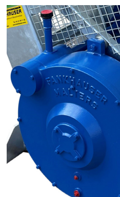
Getriebe im Ölbad Engrenage en bain d'huile