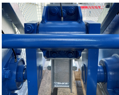
Robuste Lagerung und Kurbelwelle Palier et vilebrequin robustes