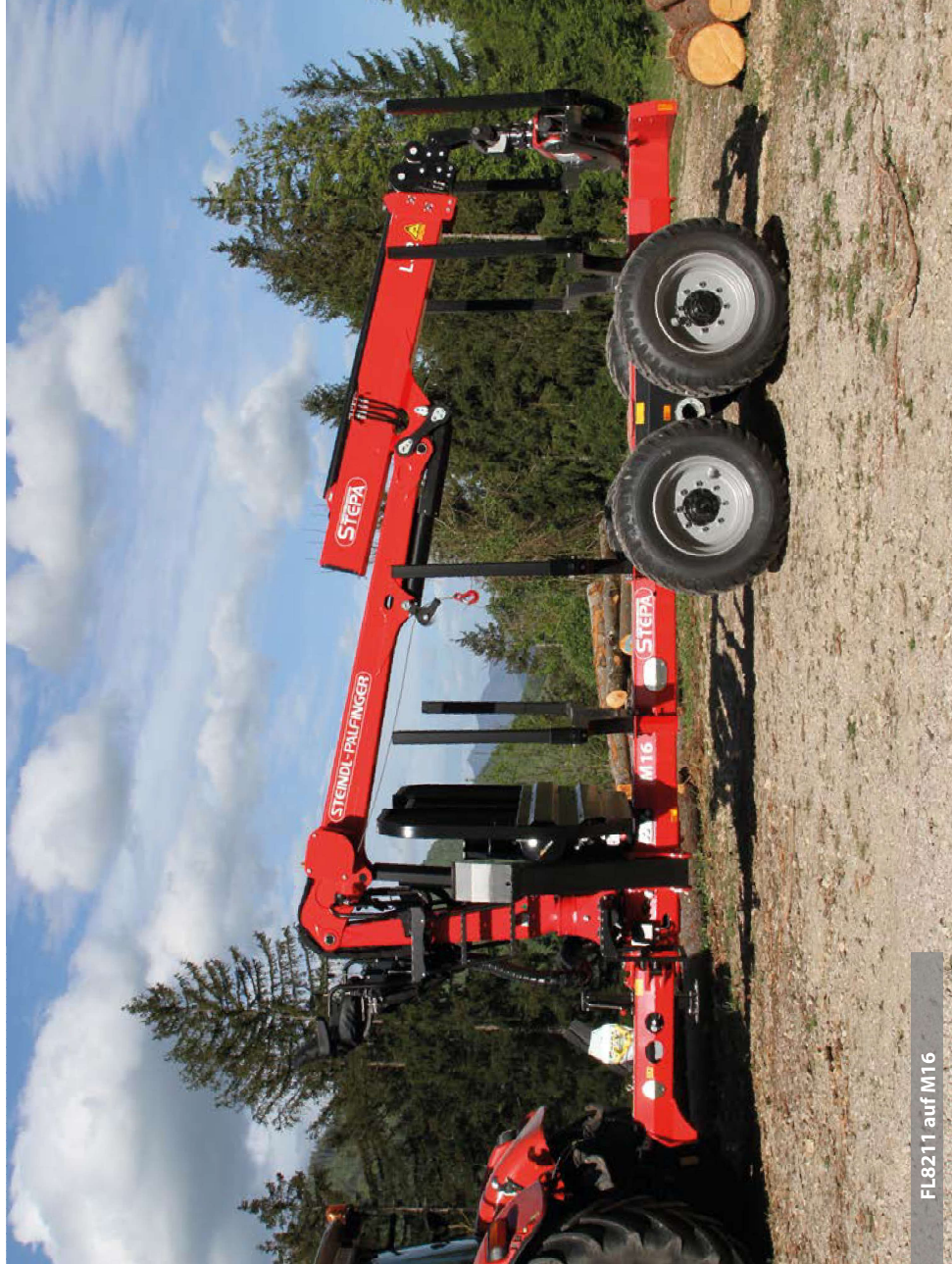
FL8211 auf M16