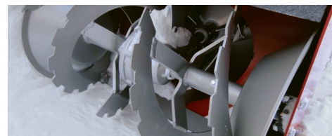
Robuste Bauweise für harte Einsätze und lange Lebensdauer

Alle Rapid Schneefräsen zeichnen sich durch ihre hohe Qualität, die rasche Einsatzbereitschaft und ihre lange Lebensdauer aus. Der massive, gezahnte Fräshaspel fräst Schnee und führt diesen dem Schleuderrad zu. Durch den Kamin wird der Schnee beim Ausschleudern sauber geführt. Somit werden grosse Schneewurfdistanzen und die präzise Lenkung an den Bestimmungsort erreicht. Sollte sich ausnahmsweise Schnee im Kamin stauen, ist der am Gehäuse angebrachte Holzstössel werkzeuglos abzunehmen und damit die Blockade rasch zu lösen.