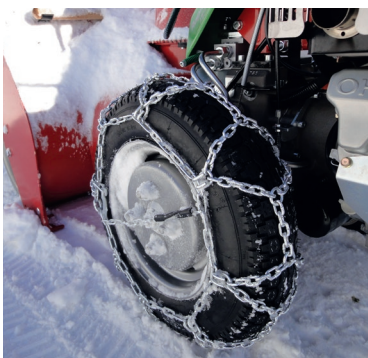
Schneeketten erhöhen Sicherheit und Arbeitsleistung

Rapid empfiehlt zur Erhöhung der Sicherheit und der Arbeitsleistung das Arbeiten mit Schneeketten. Für alle Modelle und die verschiedenen Bereifungstypen sind Leiter- oder Spurketten von Rapid erhältlich.