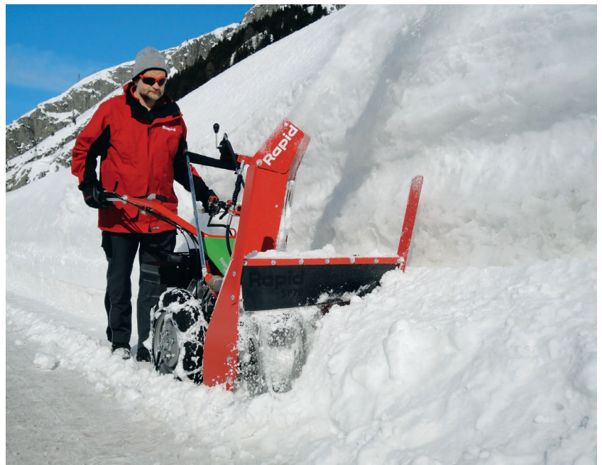
Resultat: sicheres Durchkommen nach professioneller Schneeräumung

Aufgrund des niedrigen Gesamtgewichts und ihrer geringen Abmessungen sind Rapid Geräte problemlos mit z.B. Bergbahnen zu abgelegenen Bestimmungsorten transportierbar.