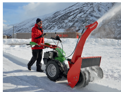
Anpassung des Schneewurfziels während der Fahrt bequem vom Holm aus

Die Bedienung der Schneefräse geschieht einfach und sicher von der Bedienposition aus. Die grosse Übersetzung im Schwenkmechanismus des Kamins lässt in jeder Situation ein rasches Anpassen des Schneewurfziels zu. Die Wurfweite ist über die Höhenverstellung der Auswurfklappe ebenfalls von der Fahrposition aus einfach einstellbar. Das ermöglicht eine einfache und komfortable Schneeräumung.