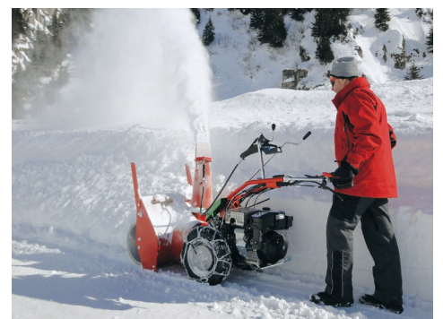
Extrem hohes Schneefördervolumen

Alle Rapid Schneefräsen sind mit einer Sicherheits-Scherschraube oder mit einer Ratschkupplung ausgerüstet. Kollidiert das Gerät mit einem Hindernis, z.B. einem Randstein oder Felsvorsprung, kommen diese Sicherheitselemente zum Tragen. Die Kraftübertragung auf die Schneefräse wird unmittelbar unterbrochen, was die Umgebung und das Material vor Folgeschäden bewahrt.