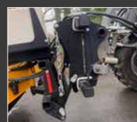
Beweglicher Rahmen: für 3. Punkt von Traktor