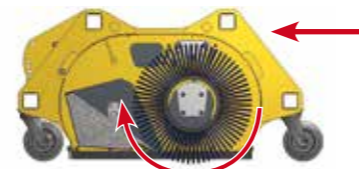
Schnittzeichnung der Kehrmaschine mit Schmutzsammelwanne.