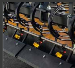
Abstreifmesser (Option): 3 Teile auf 2,80m Kehrmaschine 2 Teile auf 2,20m und 2,50m Kehrmaschine