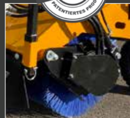
Activ'Bross System (Option)