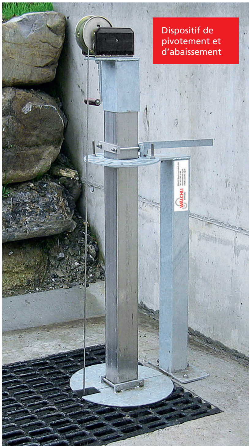
Dispositif de pivotement et d'abaissement