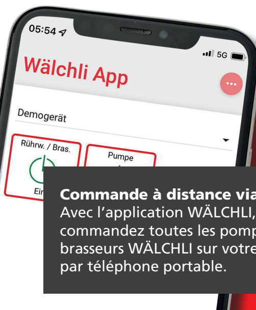
Commande à distance via smartphone Avec l'application WÄLCHLI, vous commandez toutes les pompes et tous les brasseurs WÄLCHLI sur votre exploitation par téléphone portable.