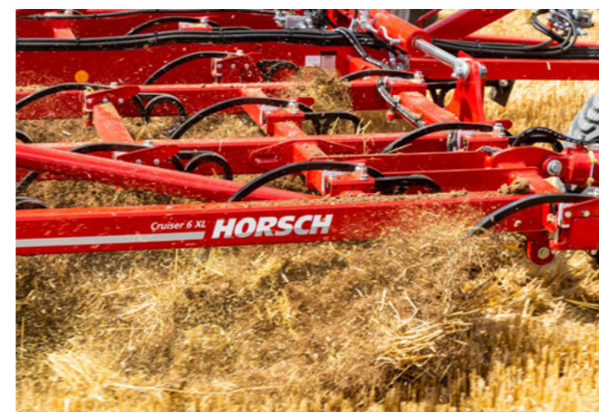
HORSCH Federzinken mit 150 kg Vorspannkraft