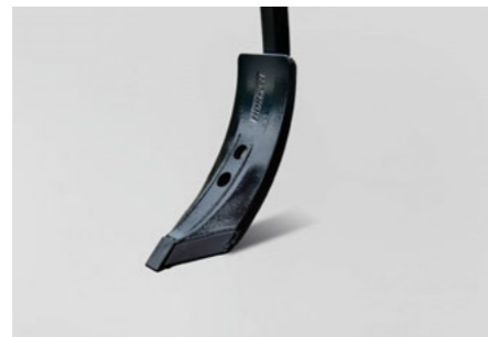
10 cm HM Schar