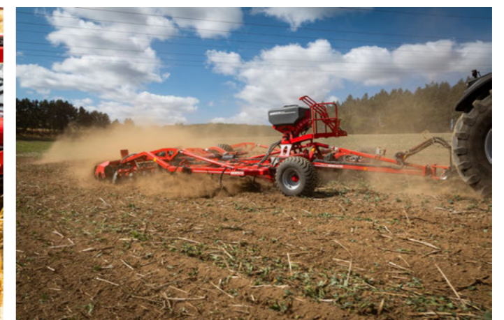
Durch 20 cm Flügelschare ist auch ein ganzflächiger Schnitt möglich