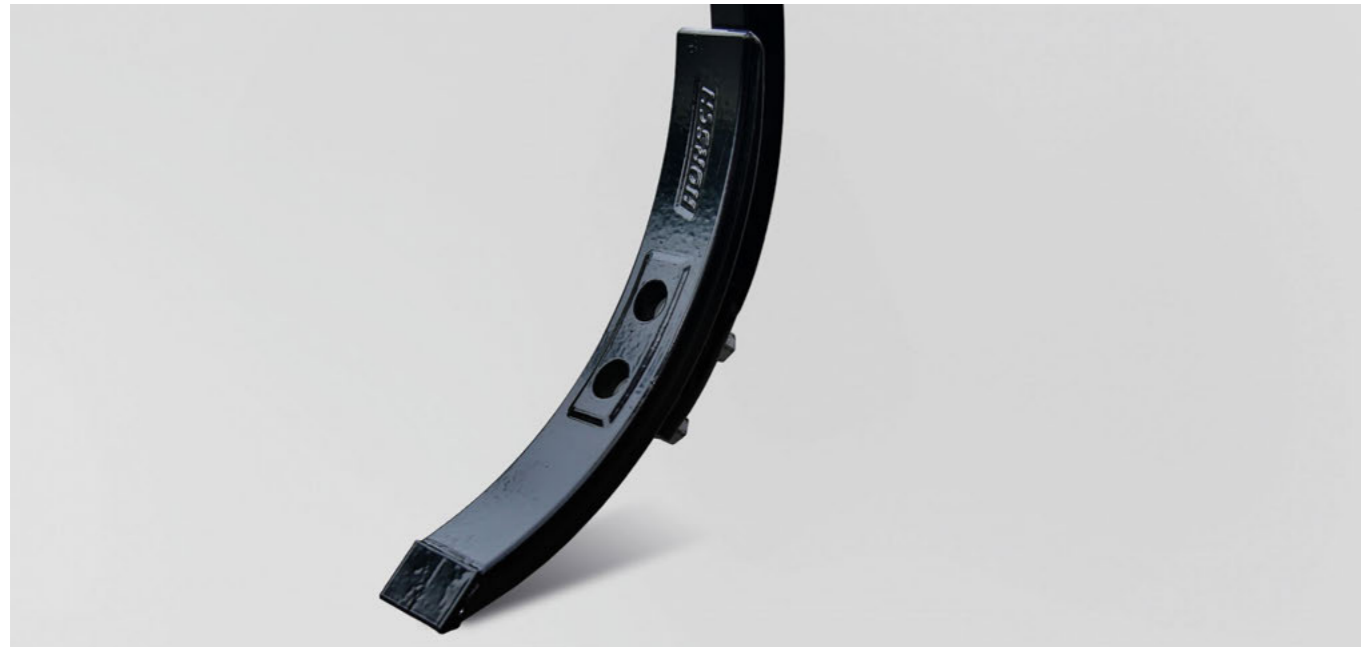
5 cm HM Schar

Durch die große Auswahl an Scharen lässt sich der Cruiser sowohl für den Stoppelsturz als auch für die Saatbettbereitung einsetzen. In Kombination mit dem vorgespannten HORSCH Federzinken ergibt sich dabei eine exakte Tiefenführung und ein ideales Einmischen des organischen Materials.