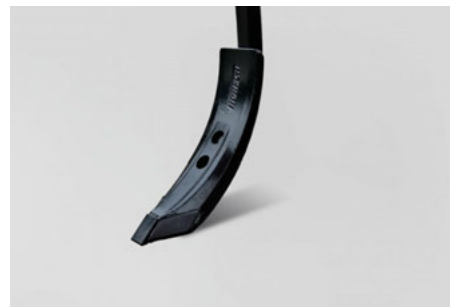
8 cm HM Schar