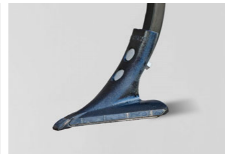
20 cm Flügelschar