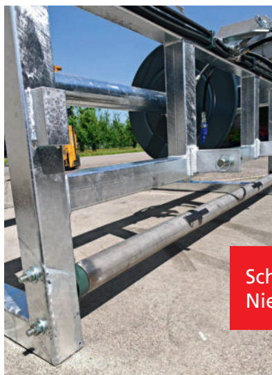
Schlauchhaspel mit Niederhalterolle