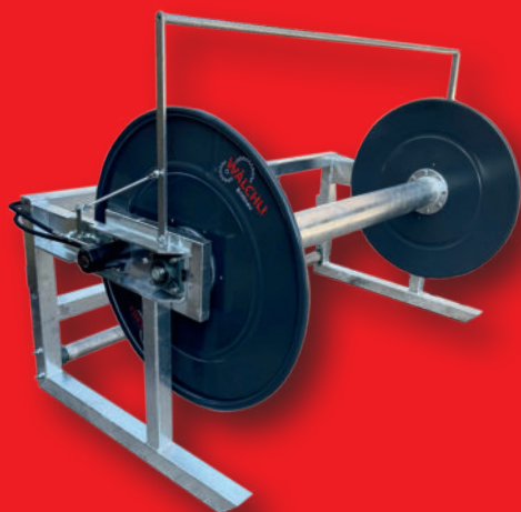
Schlauchhaspel SH 1000, extrabreite Ausführung, mit Hydraulik-Antrieb (2 Hydraulik-Motoren) und Dreipunktaufhängung