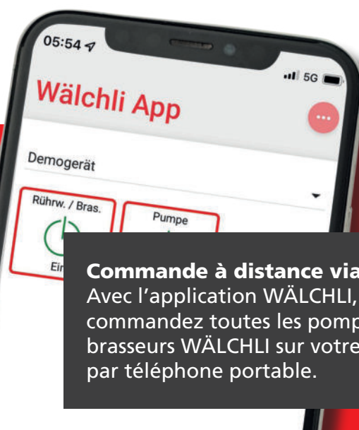
Commande à distance via smartphone Avec l'application WÄLCHLI, vous commandez toutes les pompes et tous les brasseurs WÄLCHLI sur votre exploitation par téléphone portable.