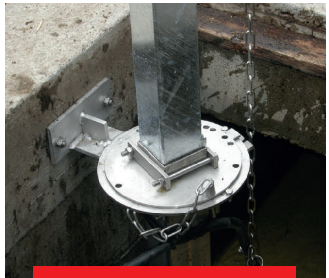
Dispositif de pivotement et d'abaissement – exécution encastrée