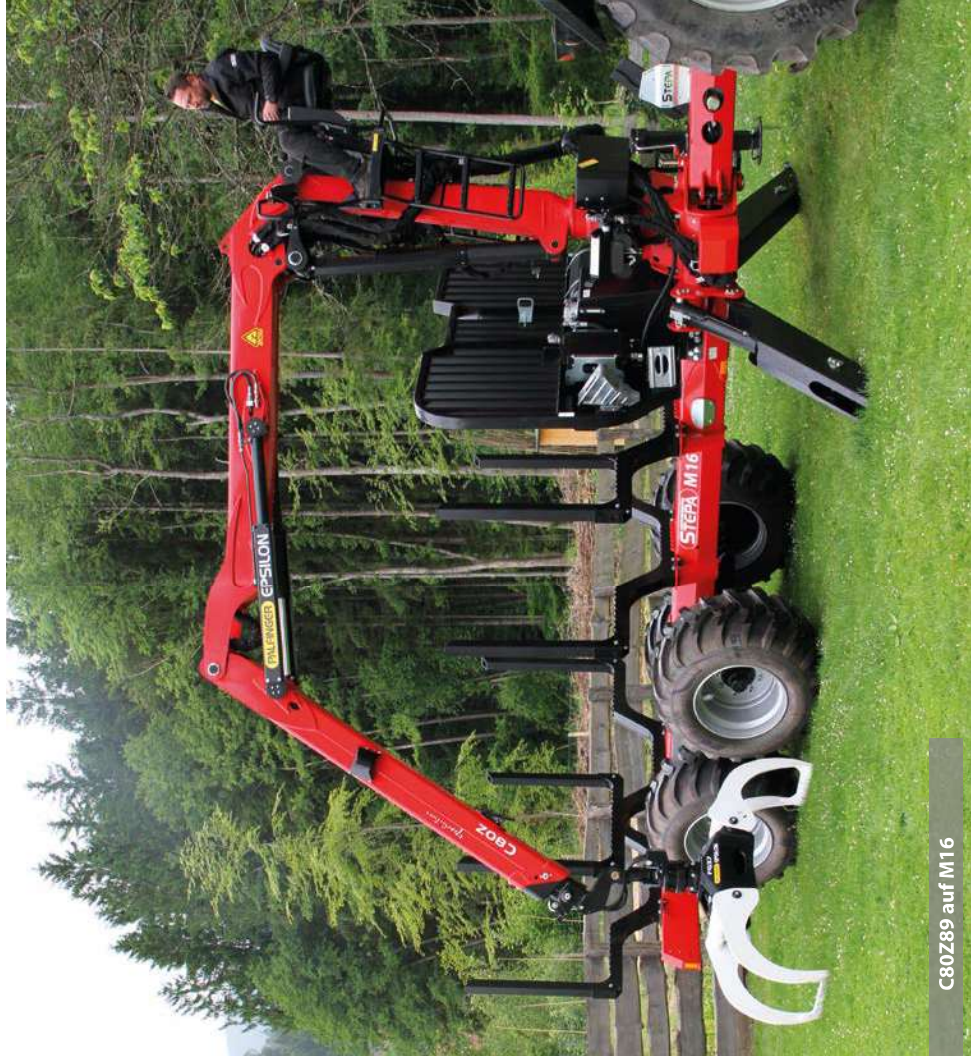
C80Z89 auf M16