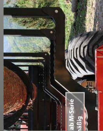
Profi-Rungen ab M-Serie serienmäßig