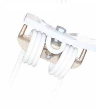
Zwei Neigungswinkel durch Drehen der Halterung um 180°