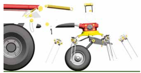
Kreisel waagrecht gestellt