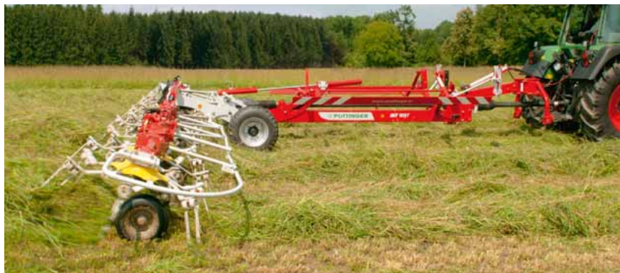
HIT 10.11 T mit Unterlenkeranhängung

Optional ist eine Unterlenkeranhängung für besonders starken Lenkeinschlag erhältlich. So folgt die Maschine Ihrer Traktorspur noch besser.