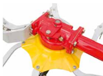
Kreisel fix verschraubt

Die beiden inneren Kreisel sind bei HIT 8.81 und HIT 8.91 mit der Ballonbereifung 16 x 9,50-8 ausgestattet. Das verbessert die Gewichtsaufnahme im Einsatz und schont den Boden.