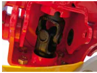
Daugeschmierte Einfach- und Doppelgelenke